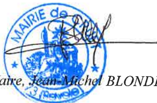
Monsieur le Maire, Jean-Michel BLONDET

Pour être affiché à la porte de la mairie, conformément à l'article L 2121-25 du Code des Collectivités Territoriales.