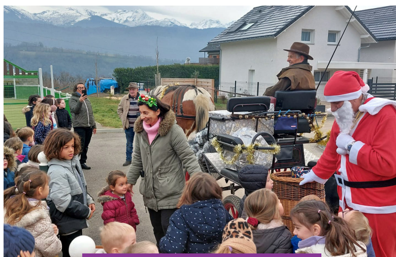
Le Père Noël rend visite aux enfants de l'école

Début juillet, comme chaque année, la remise des calculatrices par la municipalité aux élèves de CM2 a clôturé l'année scolaire.