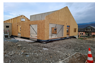
Montage des murs