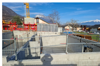
Elévation des murs du sous-sol