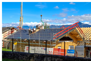
Pose de la couverture