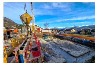
Mise en place des fondations