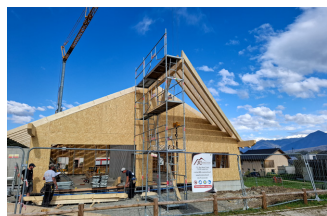
Montage de la charpente