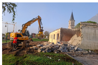
Démolition du commerce