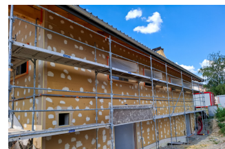
Pose de l'isolation extérieure