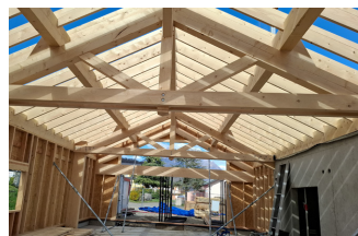
Charpente du commerce