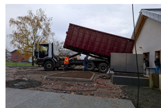
Première livraison de bois