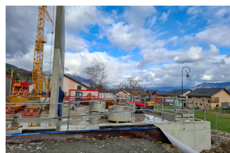
Réalisation de la dalle