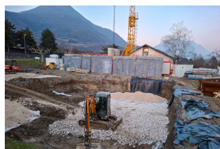
Stabilisation du terrassement