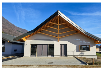
Finalisation des façades