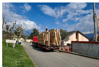
Livraison de l'ossature bois