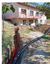
Mise en place des réseaux